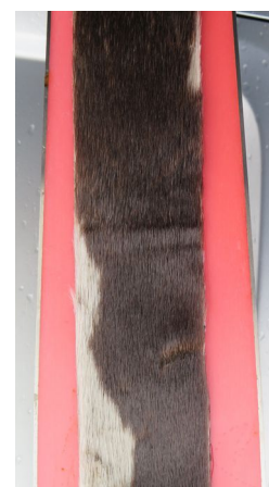
Fellene skal være midtjustert.