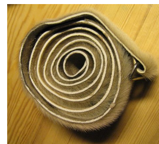
Korrekt opprullede feller.