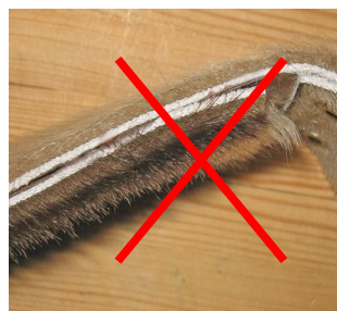
Unngå lim mot lim!