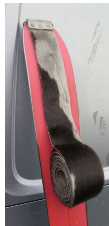
Fellene rulles på fra tuppen.

I skjøten vil pelsen kanskje bli slitt etter hvert. Det kan gi dårligere gli. Vi kan reskjøte ved å klippe vekk ca. 4 cm av fellene og deretter skjøte på nytt.