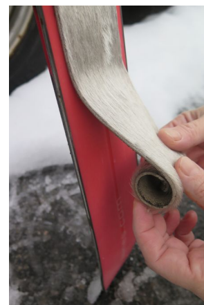
Fellene tas av bakfra med slik opprulling.